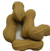
Vorsicht: Radiergummi in Erdnussform

Kaufen Sie keine Produkte, die Lebensmittel nachahmen, da sie insbesondere für kleine Kinder eine Gefahr darstellen.